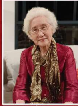
PEMBICARA IBU HOSEA