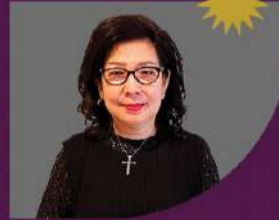
PS DR AGNES MARIA